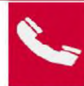
Τηλέφωνο για την καταπολέμηση πυρκαγιών

Όταν πρέπει να δείξουμε την κατεύθυνση που πρέπει να ακολουθήσουμε για να φτάσουμε στον πυροσβεστικό εξοπλισμό τότε τα αντίστοιχα σήματα συνδυάζονται ανάλογα με τα παρακάτω σήματα κατεύθυνσης