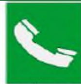
Τηλέφωνο για διάσωση και πρώτες βοήθειες

Όταν πρέπει να δείξουμε την κατεύθυνση που πρέπει να ακολουθήσουμε για να φτάσουμε στα μέσα βοήθειας ή διάσωσης τότε τα αντίστοιχα σήματα συνδυάζονται ανάλογα με τα παρακάτω σήματα κατεύθυνσης