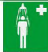
Θάλαμος καταιονισμού ασφαλείας