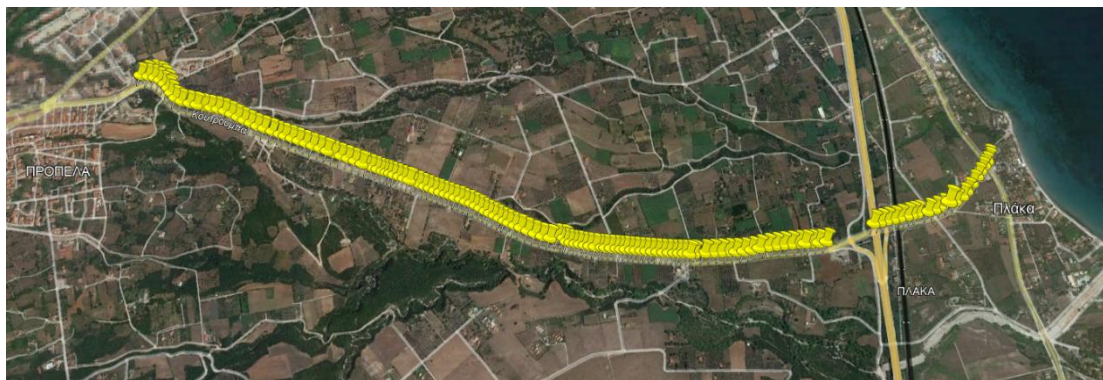
Φωτογραφία 1: Φωτιστικά επί του επαρχιακού δρόμου Λιτόχωρου - Πλάκας