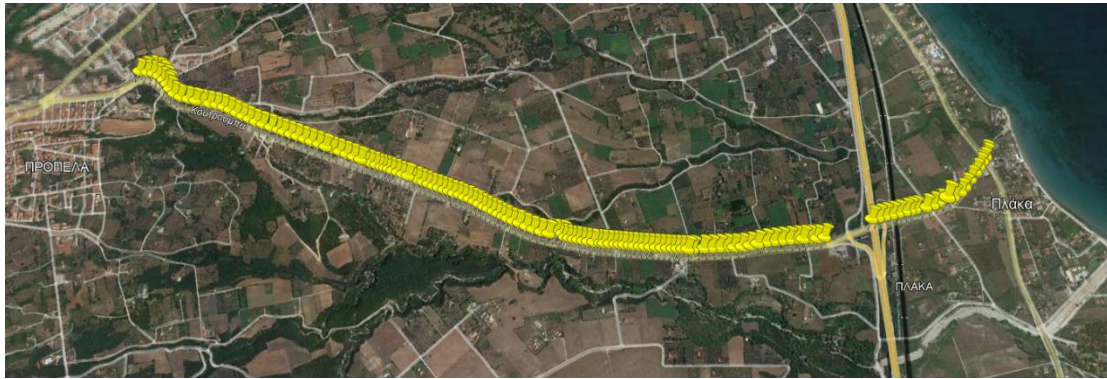
Φωτογραφία 1: Φωτιστικά επί του επαρχιακού δρόμου Λιτόχωρου - Πλάκας