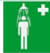
Θάλαμος καταιονισμού ασφαλείας