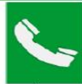
Τηλέφωνο για διάσωση και πρώτες βοήθειες

Όταν πρέπει να δείξουμε την κατεύθυνση που πρέπει να ακολουθήσουμε για να φτάσουμε στα μέσα βοήθειας ή διάσωσης τότε τα αντίστοιχα σήματα συνδυάζονται ανάλογα με τα παρακάτω σήματα κατεύθυνσης