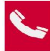
Τηλέφωνο για την καταπολέμηση πυρκαγιών

Όταν πρέπει να δείξουμε την κατεύθυνση που πρέπει να ακολουθήσουμε για να φτάσουμε στον πυροσβεστικό εξοπλισμό τότε τα αντίστοιχα σήματα συνδυάζονται ανάλογα με τα παρακάτω σήματα κατεύθυνσης