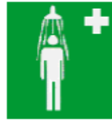
Θάλαμος καταιονισμού ασφαλείας