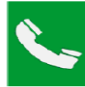
Τηλέφωνο για διάσωση και πρώτες βοήθειες

Όταν πρέπει να δείξουμε την κατεύθυνση που πρέπει να ακολουθήσουμε για να φτάσουμε στα μέσα βοήθειας ή διάσωσης τότε τα αντίστοιχα σήματα συνδυάζονται ανάλογα με τα παρακάτω σήματα κατεύθυνσης