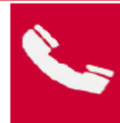
Τηλέφωνο για την καταπολέμηση πυρκαγιών

Όταν πρέπει να δείξουμε την κατεύθυνση που πρέπει να ακολουθήσουμε για να φτάσουμε στον πυροσβεστικό εξοπλισμό τότε τα αντίστοιχα σήματα συνδυάζονται ανάλογα με τα παρακάτω σήματα κατεύθυνσης